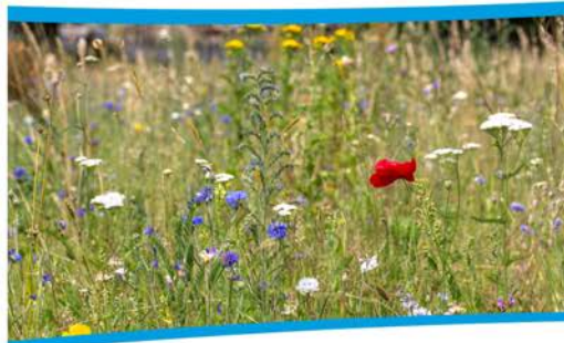
Zakładanie łąki kwietnej.

Kontakt: Centrum Nauki Keplera – Centrum Przyrodnicze http://centrumprzyrodnicze.pl