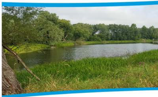
Polder Miłsko to urokliwe i ważne dla bioróżnorodności miejsce.