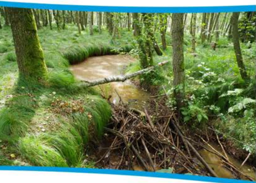
Tama bobrowa wspomaga utrzymanie wilgoci w lasach.

Na terenie Nadleśnictwa Żagań dwa kompleksy stawów rybnych o łącznej powierzchni ponad 70 ha, zasilane poprzez rzeki również borykają się z problemami związanymi z ilością wody. Z okoliczności tych z pewnością „niezadowolonych” jest wiele gatunków zwierząt. Na pomoc im, jak również ekosystemom mokradłowym ruszyły „wyspecjalizowane służby hydrotechniczne” czyli bobry, które postanowiły wziąć sprawę w swoje ręce. Chcąc utrzymać swoje obszary bytowania, wybudowały na jednym z cieków kaskadową tamę bobrową przyczyniając się tym samym do lokalnego zwiększenia retencji wodnej. Jako leśnicy dziękujemy za wsparcie i ekologiczną działalność”.