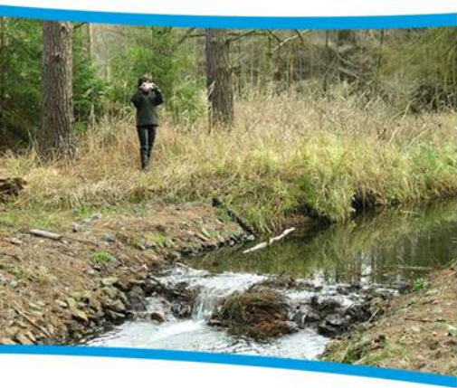
Nadleśnictwo Lubsko, próg w leśnictwie Nowa Rola.

Dzieje się to przy zastosowaniu zabiegów technicznych takich jak: budowa małych zbiorników wodnych, zastawek, jazów, jak i nietechnicznych: zalesienia, zadrzewienia, roślinne pasy ochronne, zachowanie oczek wodnych i mokradł.