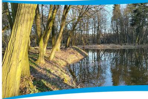
Stawy na terenie parku w Niwiskach.

Mieszkańcy stworzyli dla siebie zarówno miejsce do wypoczynku, ale również obiekt do obserwacji niezwykłego świata przyrody.