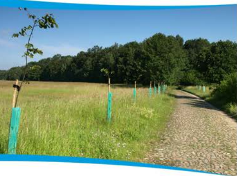
Przykłady nasadzeń zrealizowanych w gminie Kożuchów.

Ilość zadrzewień w krajobrazie rolniczym, w przeciągu ostatnich kilkudziesięciu lat znacznie zmalała. Niegdyś powszechnie sadzone na Dolnym Śląsku i Ziemi Lubuskiej, śródpolne aleje drzew owocowych i miododajnych obecnie dożywają swoich ostatnich lat. Wiele alei zostało wyciętych