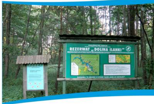
Tablice informacyjne, Dolina Ilanki.

www.kp.org.pl/pl/o-nas/nasze-ostoje/1273-ostoja-ilanka-pniow