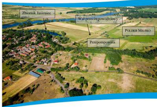
Najważniejsze elementy obecnego polderu.