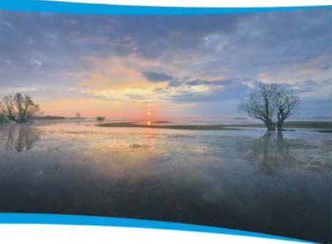
Uroda podmokłej łąki w dolinie Odry.

Często ochrona przyrody i retencja to dwa nierozdzielnie z sobą związane działania. Można to zaobserwować na terenach zalewowych Odry położonych w północno-zachodniej części województwa lubuskiego. Są to najbogatsze i najcenniejsze przyrodniczo tereny w tej części Europy. Retencjonują również olbrzymie ilości wody i to w czasie jej powodziowego nadmiaru. Dzięki temu zmniejszają skutki powodzi.