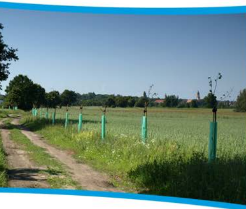
Przykłady nasadzeń zrealizowanych w gminie Kożuchów.

Wiosną 2011 roku zrealizowany został kolejny etap nasadzeń w ramach projektu „Drogi dla Natury – aleje przydrożne jako korytarze ekologiczne dla pachnicy dębowej”. W ramach projektu Fundacja Ekologiczna „Zielona Akcja” posadziła niemal 15 tys. drzew na terenie województw: dolnośląskiego i lubuskiego, w tym w gminie Kożuchów.