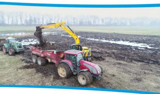
Prace przy odtwarzaniu mokradeł w Żabczynie – finansowane ze środków Programu Operacyjnego Infrastruktura i Środowisko.

zanikają. Konsekwencją utraty tych siedlisk jest obserwowany od kilku lat drastyczny spadek liczby ptaków wodnych, zarówno tych wędrownych, jak i łąkowych. W pewnym zakresie można zaradzić tym niekorzystnym zmianom, podejmując prace służące zatrzymaniu wody na łąkach. Tworzy się warunki imitujące niezakłócony przez człowieka przyrodniczy cykl - wiosenne rozlewisko, które latem, po odprowadzeniu wody, zostanie kośną lub wypasaną łąką.