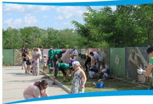
Zakładanie łąki kwietnej.

Łąki kwietne pojawiły się w Zielonej Górze za sprawą budżetu obywatelskiego. To mieszkańcy wskazali już w 2016 roku, że chcą aby były zakładane w mieście. Centrum Przyrodnicze wspólnie z Zakładem Gospodarki Komunalnej w Zielonej Górze przystąpiło w 2019 r. do realizacji projektu, który ma na celu tworzenie nowych łąk kwietnych w mieście i popularyzację tego trendu wśród mieszkańców. Okazją do spotkania z osobami zainteresowanymi był między innymi Dzień Ziemi, Piknik Naukowy, zajęcia ze studentami Uniwersytetu Zielonogórskiego i Wielki Dzień Pszczoł 2019. Podczas tych wydarzeń wspólnie z mieszkańcami została założona modelowa mini łąka kwietna na terenie parkingu Centrum Przyrodniczego.