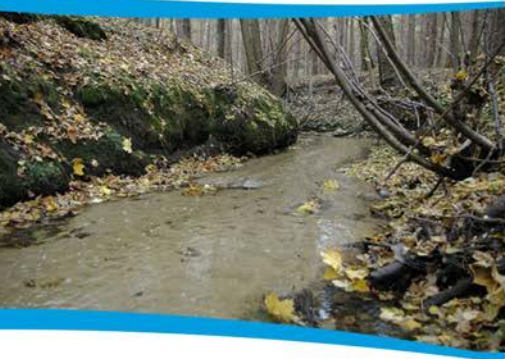
Naturalna retencja meandrującego potoku Szyszyna w Nadleśnictwie Krzystkowie.

Problemem jest to, że większość lasów to dość suche bory (ok. 76%), głównie sosnowe. Mają one mniejszą zdolność do gromadzenia wody niż lasy liściaste. Większość roślin na piaszczystych gruntach, bardziej przepuszczalnych dla wody. Między innymi dlatego na terenie Regionalnej Dyrekcji Lasów Państwowych w Zielonej Górze od kilkunastu lat prowadzone są działania związane z małą retencją wodną.