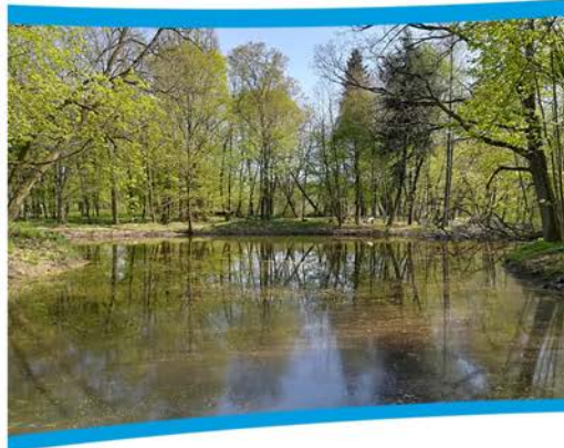
Stawy na terenie parku w Niwiskach.